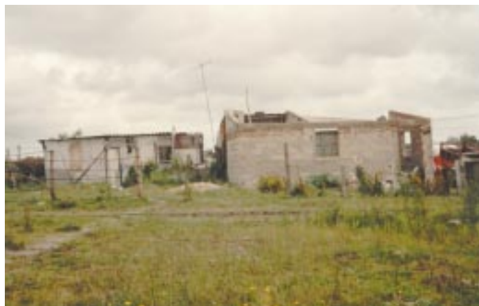
"Barrio" povero di Montevideo

Lavoriamo in una parrocchia intitolata a "Nuestra Señora del Carmen", ubicata alla estrema periferia di Montevideo, dove ogni giorno sorgono case nuove di lamiera o di materiale di scarto. Intere famiglie, per la maggioranza non regolarmente costituite, si rifugiano dove incontrano un terreno libero e vi costruiscono la loro baracca e poi vanno di porta in porta cercando un lavoro che gli dia da vivere per la giornata. In questo ultimo anno di questi nuclei ne sono sorti molti e sono abitati, nella maggioranza, da bambini che soffrono il freddo o il caldo e più di tutto la mancanza di cibo quotidiano. Molti giovani e adolescenti per mancanza di lavoro si sono dati al furto per cui la zona non è sicura, non si può