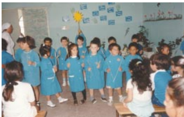
Bambini della scuola materna in festa

lasciare la casa incustodita o con una sola persona. Noi Suore siamo alla direzione e amministrazione di una Scuola Materna di circa 150 bambini dai 2 ai 3 anni di età che sono dei più poveri. In più una volta la settimana abbiamo un laboratorio di formazione dove si impartiscono alle mamme lezioni su come allevare il proprio figlio e al bambino si danno le prime cure. La maggioranza sono tutti figli di giovanissime madri, alcune adolescenti, che non hanno marito o che sono provvisoriamente con un uomo.