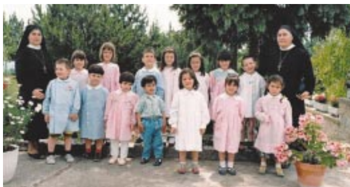
Bambini della scuola materna