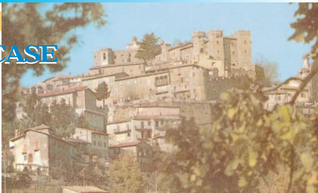
Collalto Sabino, il paese che diede i natali alla Congregazione