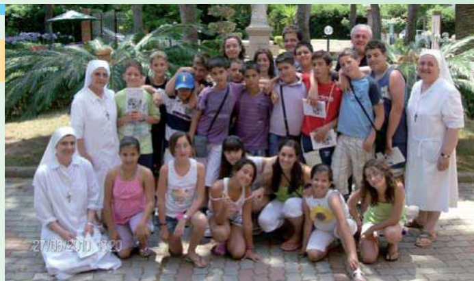
Ritiro A.G.M. Ragazzi (Santa Severa - RM) - Foto di gruppo