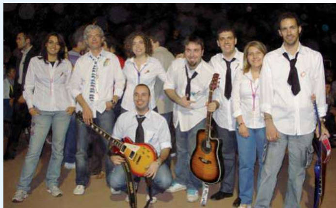
Roma - Partecipanti al Good News Festival