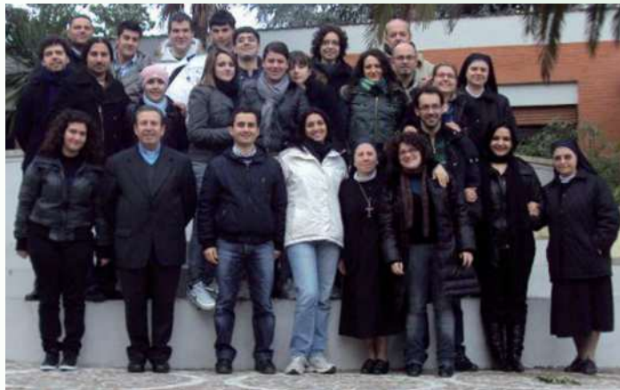
Ritiro A.G.M. (Sacrofano) - Foto di gruppo

Sabato 20 e domenica 21 febbraio a Sacrofano in provincia di Roma si è tenuto il ritiro spirituale dell'A.G.M. nella casa "Fraterna Domus"; il movimento si è ritagliato il