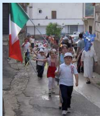
CASCANO - I bambini in corteo

del proprio paese, esprimendo attraverso lo sport la gioia dello stare insieme, come ciclo conclusivo annuale del percorso progettuale di socializzazione. Questa edizione ha raggiunto l'apice dell'emozione quando i bambini hanno intonato l'Inno di Mameli, con le manine sul cuore, hanno creato un "unicum" da cui attingere forza e orgoglio per rinsaldare i valori della convivialità e della solidarietà. I giochi hanno divertito i bambini e i genitori, nu-