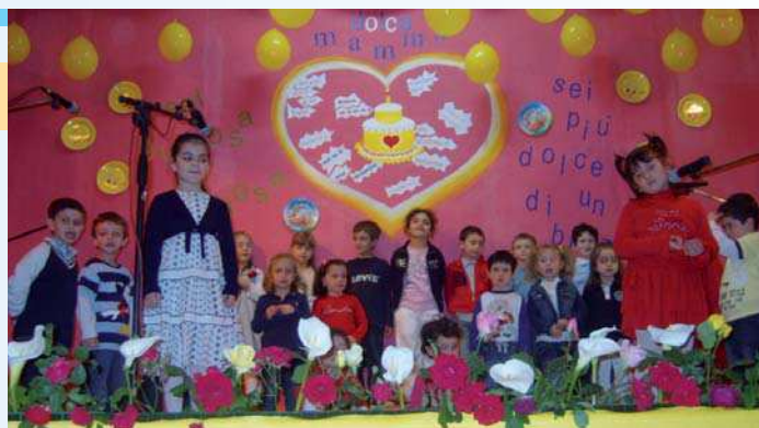
CASCANO - Festa della mamma

Ancora una volta gli allievi della Scuola dell'infanzia "Maria Immacolata" di Cascano hanno regalato alle famiglie e alla comunità momenti di piacevole intrattenimento e comune riflessione. Domenica 16 maggio 2010, giorno dell'Ascensione al Cielo di Nostro Signore, i bambini, infatti, hanno portato in scena presso il salone della scuola "Dolce