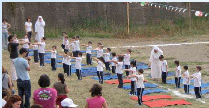
CASCANO - Mini Olimpiade

Cascano ha avvolto nel Tricolore le sue vie e i suoi vicoli, scaldati dalla fiamma olimpica innalzata ai semplici ma autentici valori dell'amicizia. Lo spirito della "Mini Olimpiade", organizzata dalla Scuola dell'Infanzia delle Suore di Cascano, sabato 12 giugno c.a., ha fatto proprio il senso di appartenenza alle radici