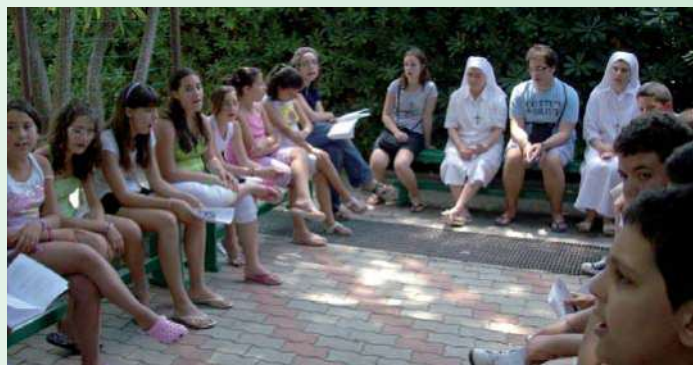
Ritiro A.G.M. Ragazzi (Santa Severa - RM) - Momento di condivisione